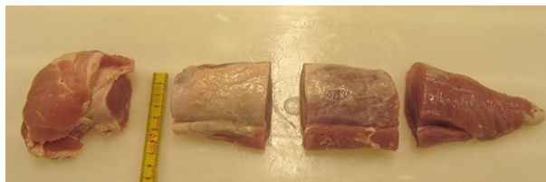
Mørbrad, 2 stege. Længde 8 cm, bredde 5,5 - 7 cm, højde 3 - 3,5 cm

Der blev i alt anvendt 9 podede stykker til varmebehandling og 1 stykke upodet til temperaturmåling og 9 stykker til kontrol. Efter udskæring blev kødet opbevaret ved 0 °C indtil opstart af podedeforsøg. Alt kød blev tempereret til 5 °C inden start af varmebehandling.