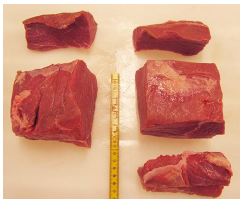
Oksekyderlår, bredde 8 cm, højde 7 - 8 cm

Til forsøget blev anvendt mørbrad, kam u/svær, skinkeyderlår m/lårtunge og oksesteg af yderlår.