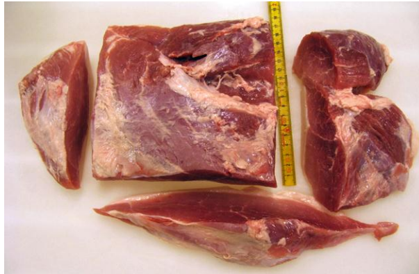
Skinkesteg, yderlår m/lårtunge og fedtkant, længde 16 cm, bredde 14 cm, højde 6 - 6,5 cm