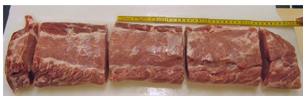
Kam, 3 stege, længde 15 cm, bredde 13 cm, højde 5 - 5,5 cm