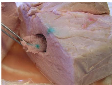
Figur 2 : Prøveudtagning af grønfarvet centrum

Det farvede område blev udskåret med steril skalpel (se figur 2), og prøverne blev analyseret for L. monocytogenes på Oxford agar (Oxoid CM0856) og inkuberet ved 37 °C i 2 døgn.